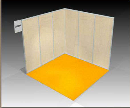
Stand 9m 2 Sans raidisseur